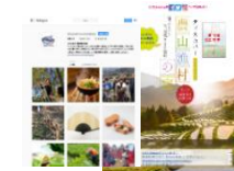
WebサイトやSNSで 優良事例の情報を発信