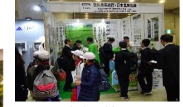
農業遺産の情報を発信