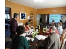
地域の活動計画の策定 (ワークショップの開催)