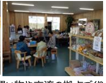
移動販売 買い物や交流の拠点づくり (多機能型拠点施設)