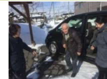
体制構築及び実証活動 (高齢者の移動確保)