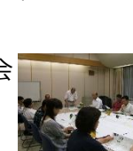
合意形成、計画づくり