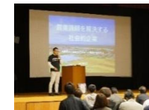
Webサイト運用やイベント開催で 新たな事業の情報を発信