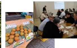
農山漁村への理解を深めるため、地域活動に参加